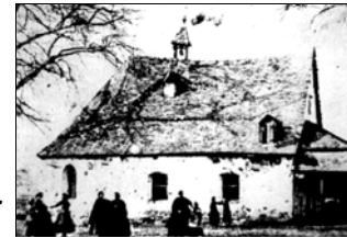
Die Gezelinkapelle um 1900

Diese Kapelle ist im 15. Jh. als Heilighäuschen über der Gezelinquelle erwähnt. 1659 errichtete der Deutschordenskomptur von Reuschenberg zu Morsbroich einen Neu-