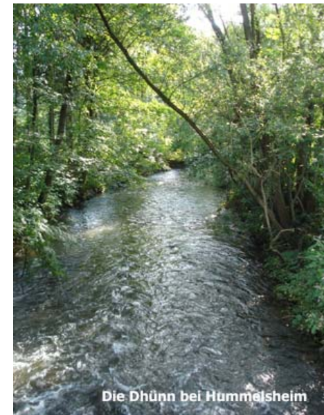
Die Dhünn bei Hummelsheim

Erwandern und erleben Sie mit uns das Bergische Land