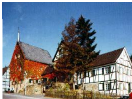
Museum für Bergbau, Handwerk und Gewerbe im historischen Türmchenhaus

Gerne stellen die am Fernwanderweg 30 liegenden SGV-Ortsvereine ihre Wanderprogramme zur Verfügung, oder wenden Sie sich bitte mit ihren speziellen an den SGV-Bezirk Bergisches Land e.V.